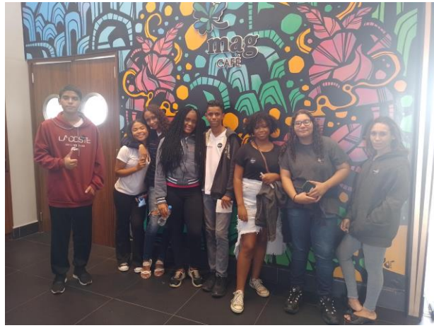
Foto: Atividade externa - Farol Santader