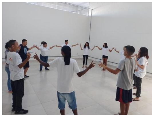
Foto: Tirada na Casa dos Anjos durante encontro presencial Foto: Tirada na Casa dos Anjos durante dinâmica de grupo