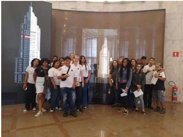
Foto: Atividade externa - Farol Santader