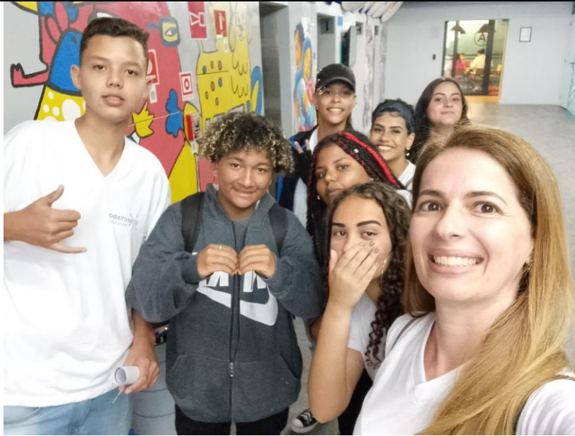
Foto: Atividade externa - Estação Hack

Unidade I – Casa dos Anjos | Unidade II – Casa Betel | Unidade III – Casa Hosana